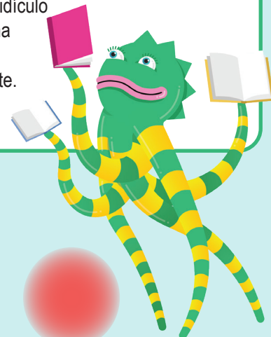
Ilustración de aliteración. Inventar algún trabalenguas ridículo y dibujar alguna ilustración correspondiente.

Usar tiza para escribir mensajes en la vereda para los que pasen por ahí.